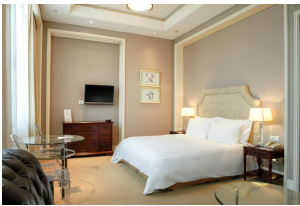
Sunrise On The Bund Hotel Luxury Hotel ★★★★★ Shanghái, China