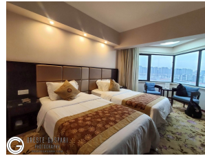
Jinling Aster Hotel Suzhou Hotel ★★★★★ Suzhou, China