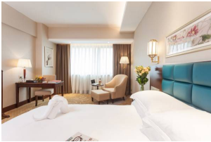
Hangzhou Zhongwei Sunny Hotel Hotel ★★★★★ Hangzhou, China