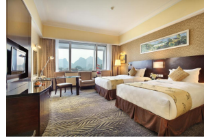
Lijiang Waterfall Hotel Hotel ★★★★★ Guilin, China